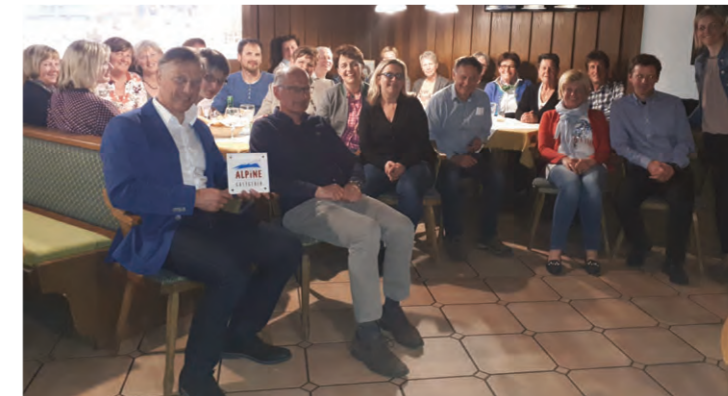
Jahreshauptversammlung in Radstadt am 19. April 2018.