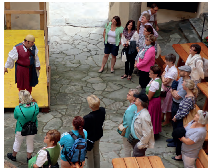
Führung durch die Burg Mauterndorf.