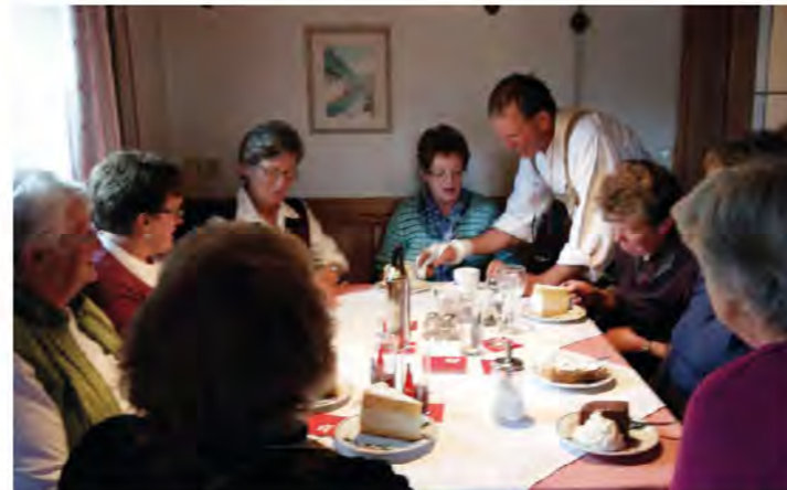
Die Privatvermieter der Ortsstelle Lofer werden von den Wirtsleuten der Jausenstation Krepper mit Kaffee und Kuchen verwöhnt. Allen ein herzliches Dankeschön für die Hilfe beim Bauernherbstfest.

Nur mit vereinten Kräften kann so ein schönes Fest gelingen.