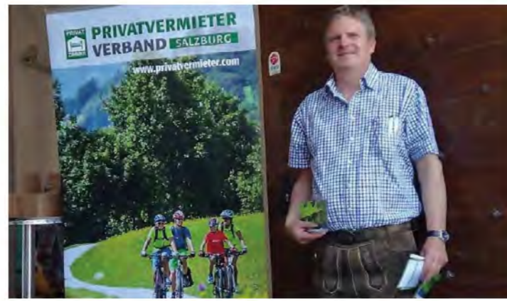
Gemeindetag Unken in der neuen Residenz Salzburg.

Besonders wurden die zahlreichen Besucher auf die Plattform der Privatvermieter von Unken www.unken.co , hingewiesen, und mit entsprechenden eigenen Flyern der Ortsstelle Unken, und Werbematerial vom Landesverband versorgt.