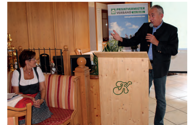
Thomas Schanzer, Obmann des Bundesverbandes „Privatvermieterverband Österreich“ freut sich über die positive Stimmung in Salzburg.