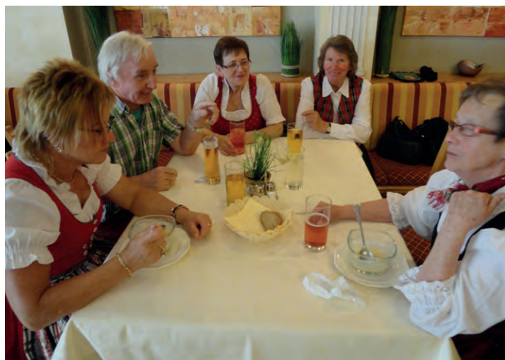
Besonders wichtig auch der Erfahrungsaustausch und das „gmiatliche zomsitzn“ während der Jahreshauptversammlung.