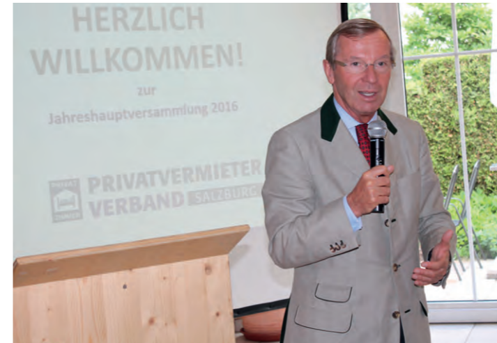
„Die Salzburger Privatvermieterinnen und -vermieter liefern einen verlässlichen Beitrag zum nachhaltigen Erfolg der Salzburger Tourismuswirtschaft“, betont Landeshauptmann Dr. Wilfried Haslauer