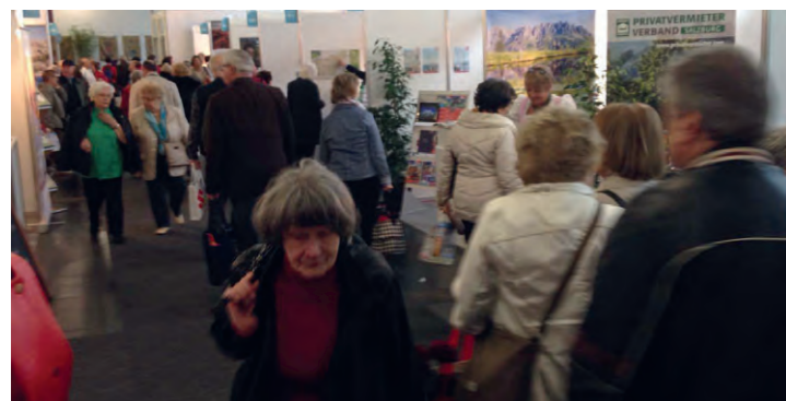
Mit 48.500 Besuchern verzeichnete die Messe eine Besuchersteigerung.

Neben der quantitativen Besuchersteigerung ließ sich vor allem auch eine Steigerung in der Qualität der Besucher verzeichnen. Viele Aussteller berichteten von einem deutlichen Umsatz-Plus.